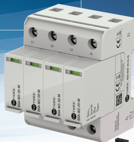
BSA-W2-20 (4+0) Klasse II

Unsere Geräte für Blitz- und Überspannungsschutz der neusten Generation erhielten ein modernes Design, haben einen patentierten Modulverriegelungsmechanismus und sind dadurch schock- und vibrationsresistent. Mit der neu konzipierten thermischen Abtrennung und der ebenfalls patentierten Schutztechnologie ist keine zusätzliche Vorsicherung bei einer Absicherung bis 315A erforderlich. Sie bestehen aus vier gasgefüllten Funkenstrecken in Serie mit Hochleistungs-Metalloxid-Varistoren. Die Funktionsanzeigen wurden verbessert. Im Auslösefall wechselt die Anzeige von grün auf rot. Wie gewohnt steht ein Fernsignal-Kontakt zur Verfügung. Das zweiteilige Gerät ermöglicht beim Defekt einen einfachen und schnellen Austausch ohne neue Verdrahtung durch Herausziehen des Steckmoduls und Einsetzen eines neuen Moduls.